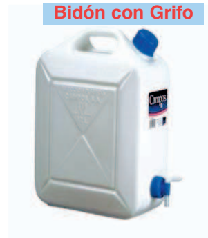
Bidón con Grifo