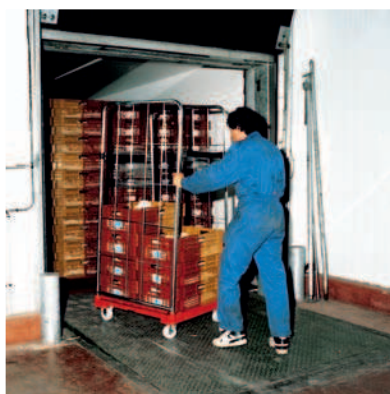
Ideal para el sector de la Distribución.