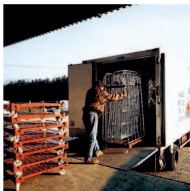
Apilado de las bases-Ahorro Logístico.