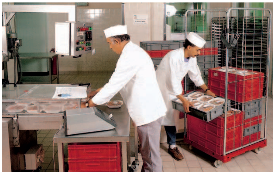
Sector de Restauración, diversidad y seguridad en cargas Pesadas.