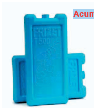
Acumuladores para Frío