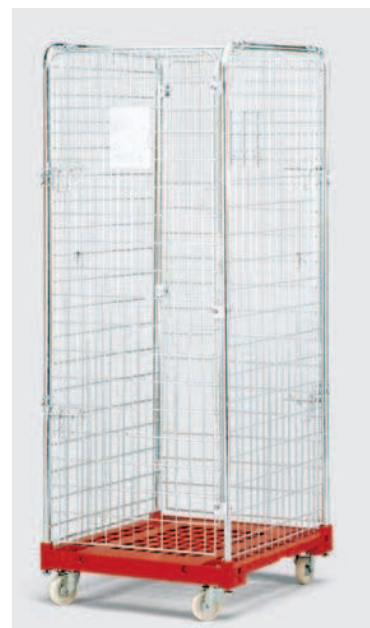
Jumboroll de Seguridad con apertura puerta.