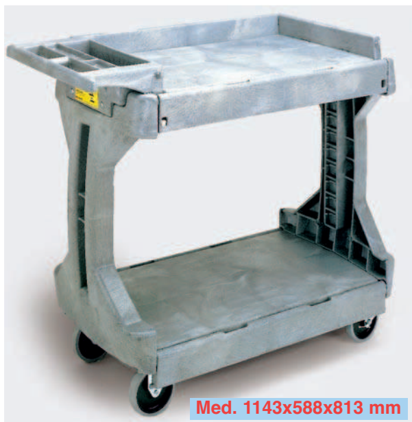
Med. 1143x588x813 mm