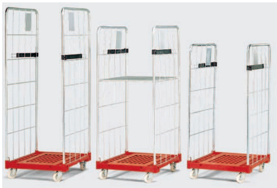
Base de plástico con Refuerzos metálicos que reducen el peso de trabajo.