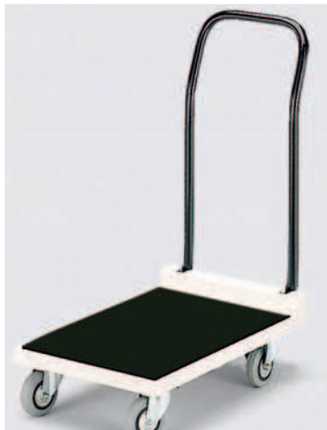
Timón Epoxi Abatible