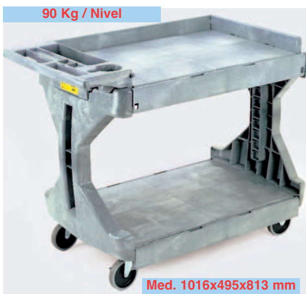
90 Kg / Nivel