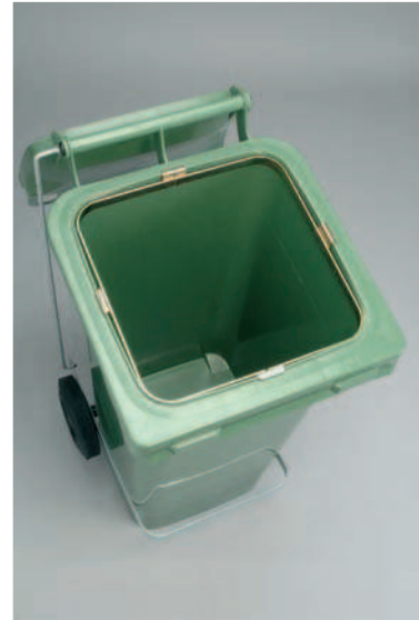
ARO SUJETA BOLSAS