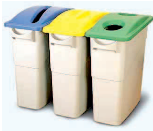
Papelera Selectiva 87 lts. carro con Ruedas opcional. Med.51x28x76 cm. Polietileno