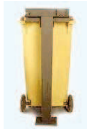
Para Fijar Contenedor de 2 Ruedas