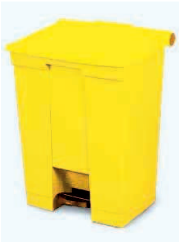
Papelera 45 lts, en polietileno, con Pedal de Apertura y tapa incorporado. 3 Colores