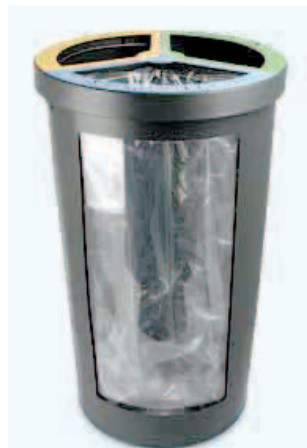
Papelera selectiva en chapa de Acero, y laminas de policarbonato transparentes Vol.. 120 Lts. Fijación al suelo mediante tornillos.