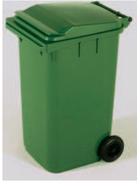
Basurera Rodante con Tapa y Asa 240 lts