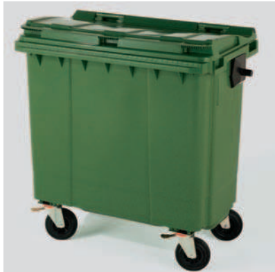
Basurera Rodante con Tapa y Asa 770 lts, Aprehensiones para volteo.