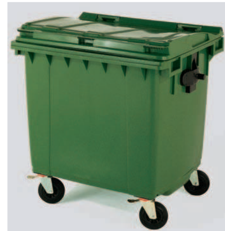
Basurera Rodante con Tapa y Asa 1000/1100 lts, Aprehensiones para volteo.