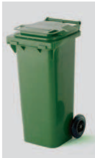
Basurera Rodante con Tapa y Asa 80 lts

Ergonomía y diseño racional de los residuos.