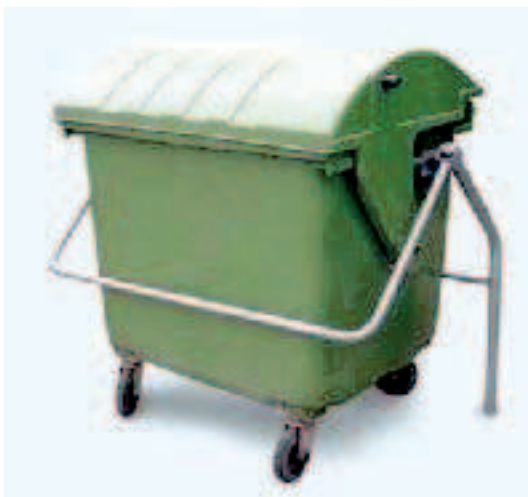
Para Fijar Contenedor de 4 Ruedas