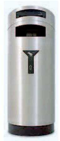
Papelera metálica urbana-residuos caninos.Cap. 150 lts, incorpora cenicero.