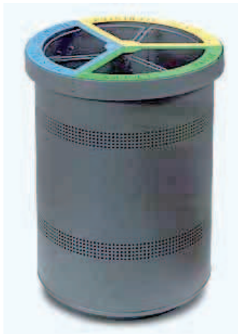
Papelera selectiva en chapa de Acero, Vol.. 50 Lts. Fijación al suelo mediante tornillos.