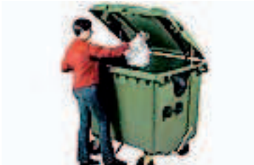
PEDAL DE APERTURA