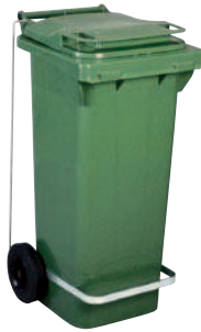
Opción PEDAL DE APERTURA