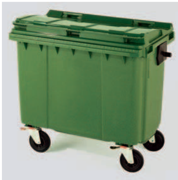
Basurera Rodante con Tapa y Asa 660 lts, Aprehensiones para volteo.