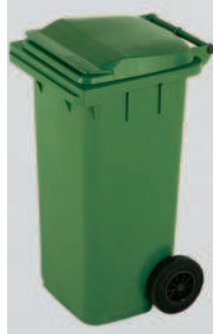
Basurera Rodante con Tapa y Asa 120 lts