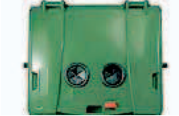
RECOGIDA DE VIDRIO