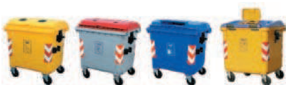
RECOGIDA SELECTIVA PERSONALIZADA MEDIANTE COLORES Y LOGOTIPOS