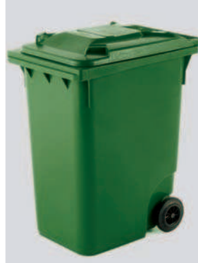
Basurera Rodante con Tapa y Asa 360 lts