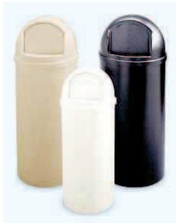
Papelera tapa basculante en polietileno. Disponible en 57 y 96 lts. Exterior é interior.