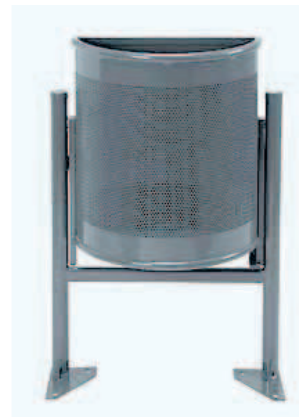
Papelera metálica urbana, semi-circular, 35 Lts. Acabado negro.