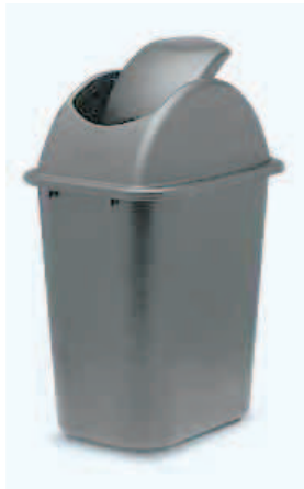
Papelera tapa basculante en polietileno. Disponible en 26 y 39 Lts de capacidad.