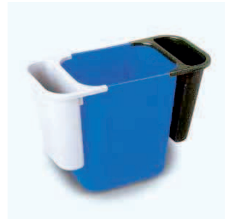
Papelera Selectiva de oficina, con separadores opcionales Vol.. 4 lts.