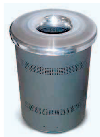
Papelera Fabricada en Acero Cincado.100 Lts.